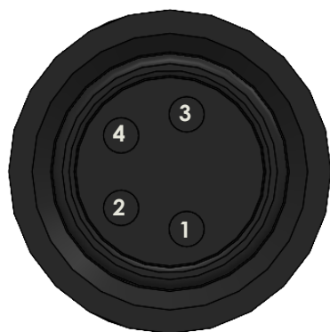
DETTAGLIO A SCALA 5 : 1